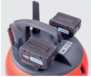
Akkus, Bedientaster und Standard-Zubehör