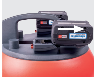
Einfaches Montieren/ Demontieren der Akkus