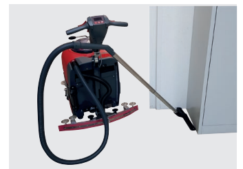
Wassersaug-Set mit Saugschlauch und Teleskoprohr (optional)