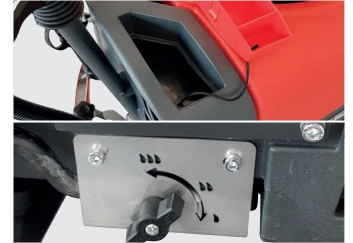
Einfüllöffnung Frischwassertank Wassermengenregler