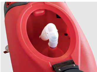
Grosser Schmutzwassertank mit effizientem Motorschutz dank Schwimmersystem