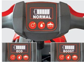
Digitale Anzeige 3 Saugleistungsstärken