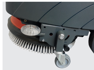
Transportrad für einfachen Transfer (optional)