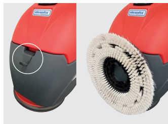
Bürstenhalter für Schrubbürste (optional)