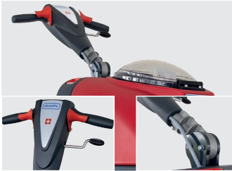
Ergonomischer Griff, verstellbarer mit Handhebel

Mit dem cleveren Zubehör, wie dem Bürstenhalter oder dem Transportrad zum einfachen Transportieren und Parken der Maschine, haben Sie alles, was Sie brauchen.