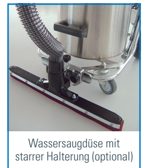
Wassersaugdüse mit starrer Halterung (optional)