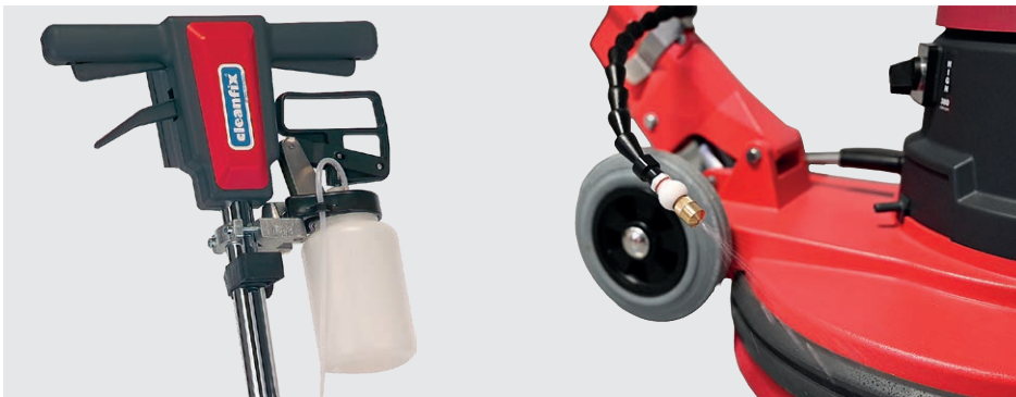
Sprühgerät für die gezielte und gleichmässige Dosierung des Reinigungsmittels (optional)