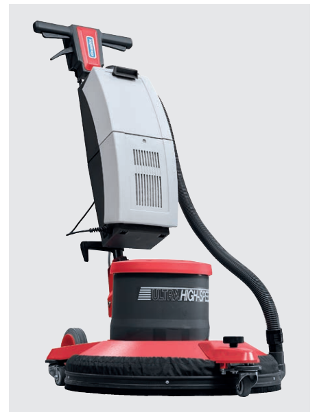
Mit Absaugereinheit AS 05 (optional)