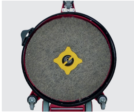
Maschine mit integriertem Treibteller