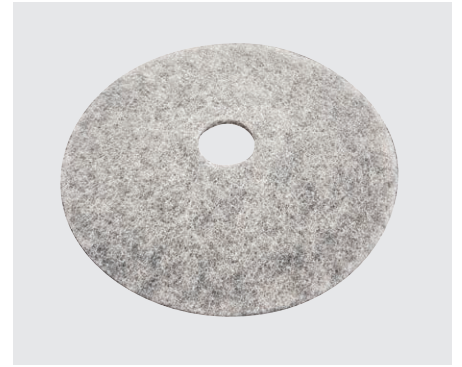
Pad High-Speed Naturborsten (optional)