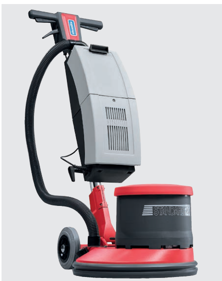
Einfache Montage der Saugeinheit (optional)