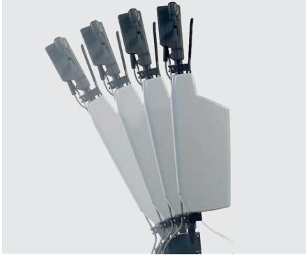
Stufenlose Stielverstellung, optional mit Laugentank