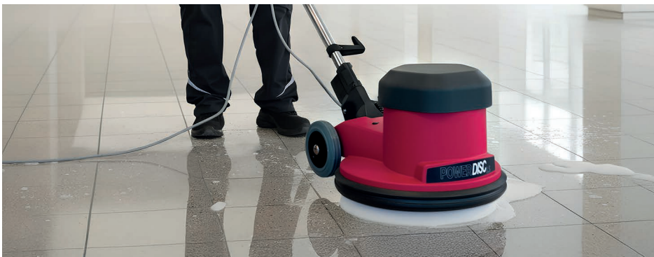
Zuverlässige Einscheibenmaschine für gründliche Reinigung in öffentlichen, gewerblichen und sensiblen Bereichen.