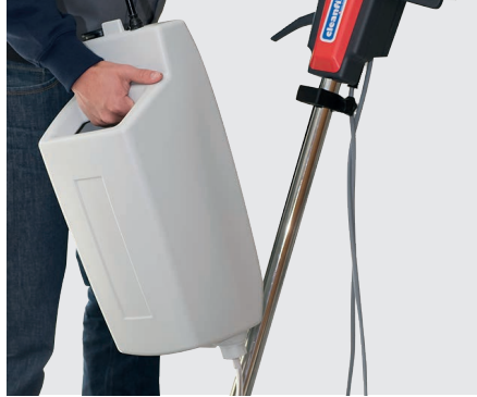
Einfache Montage und Demontage des Laugentanks (optional)