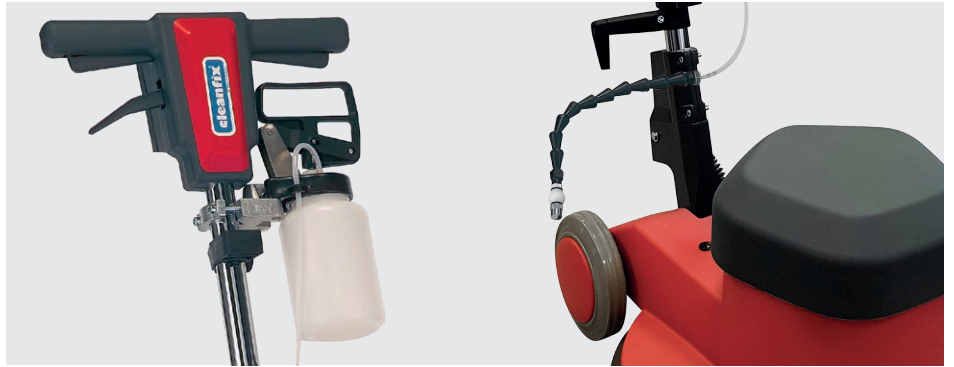
Sprühgerät für die gezielte und gleichmässige Dosierung des Reinigungsmittels (optional)