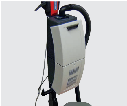
Einfache Montage der Saugereinheit AS 05 (optional)