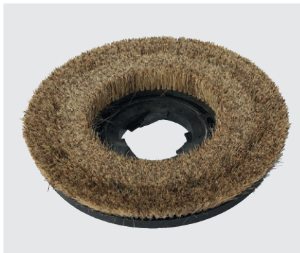
Polierbürste (Mexican Fibre) (optional)