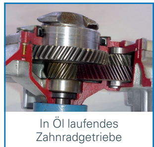
In Öl laufendes Zahnradgetriebe