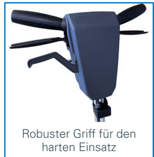
Robuster Griff für den harten Einsatz