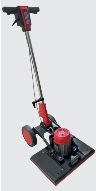
E50x35 Excenter Lieferumfang