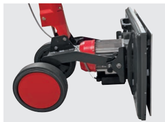
Bürstkopf aufgestellt für die optimale Lagerung