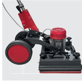
Räder vom Boden abheben um keine Laufspuren zu hinter- lassen