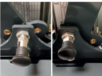
Arretierung mit Rastbolzen (Sonderzubehör)