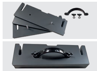
Gewichte einfach adaptierbar (Sonderzubehör)