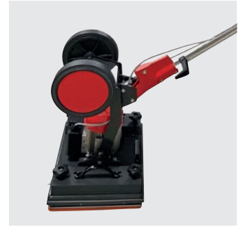
Deichsel auf Kopf stellen für maximales Arbeitsgewicht