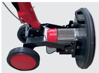
Bürstkopf aufgestellt für die optimale Lagerung