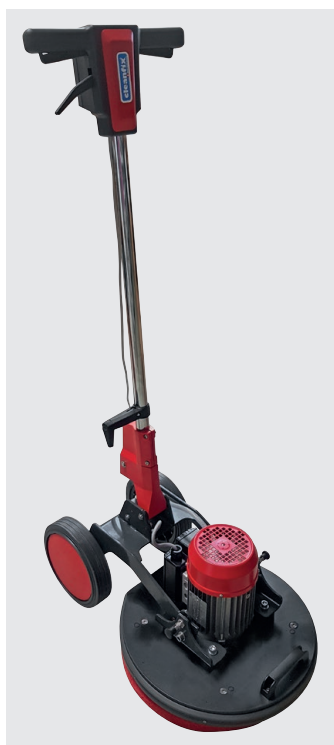
E44 Excenter Lieferumfang

Unsere patentierte Stielverstellung sowie die grossen Räder für den einfachen Transport sind bedeutende Vorteile. Von Nutzen sind auch die zwei Rasten (750.586 Kit Rastbolzen) auf dem Gehäuse, mit denen Sie entweder die Räder vom Boden abheben um keine Laufspuren zu hinterlassen oder die Deichsel komplett auf den Kopf stellen können um ein maximales Gewicht auf den Boden zu bekommen. Durch gestückelte Zusatzgewichte können Sie das Maschinengewicht perfekt Ihrer Anwendung adaptieren. Stellen Sie den Bürstkopf von der E44 Excenter einfach auf und Sie können die Pads bequem wechseln oder die Maschine optimal lagern.