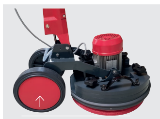
Räder vom Boden abheben um keine Laufspuren zu hinter- lassen