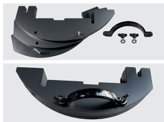
Gewichte einfach adaptierbar (Sonderzubehör)