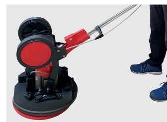
Deichsel auf Kopf stellen für maximales Arbeitsgewicht