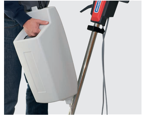
Einfache Montage und Demontage des Laugentanks (optional)