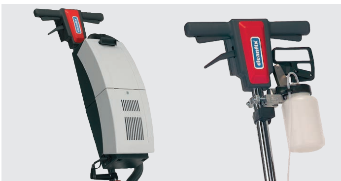
Saugereinheit AS05 und Sprühgerät 1 Liter (optional)